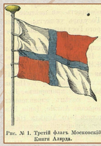
Рис. № 1. Третій флагъ Московскій. Книги Аляра.