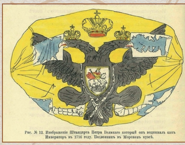
Рис. № 12. Изображение Штандарта Петра Великого который онъ поднималъ какъ Императоръ въ 1716 году. Подлинникъ въ Морскомъ музее.

(желтое полотнище с черным двуглавым орлом, держащим в клювах и лапах карты четырех морей).